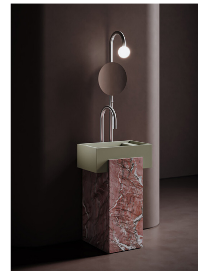
Tiore badeværelsesmøbel af Fabian Freytag, pris på forespørgsel (Vallone).