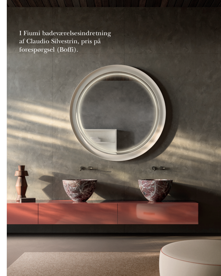
I Fiumi badeværelsesindretning af Claudio Silvestrin, pris på forespørgsel (Boffi).