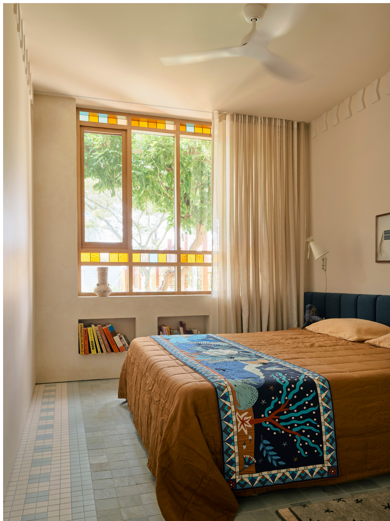
Soveværelse fra projektet Mo Jacobsen af YSG Studio. Sengegavlen er designet af YSG Studio, og den håndbroderede sengetæppe er af Louis Barthélemy. Cone væglampen er fra Warm Nordic, og gulvfliserne Zen Quartzite er fra Surface Gallery.