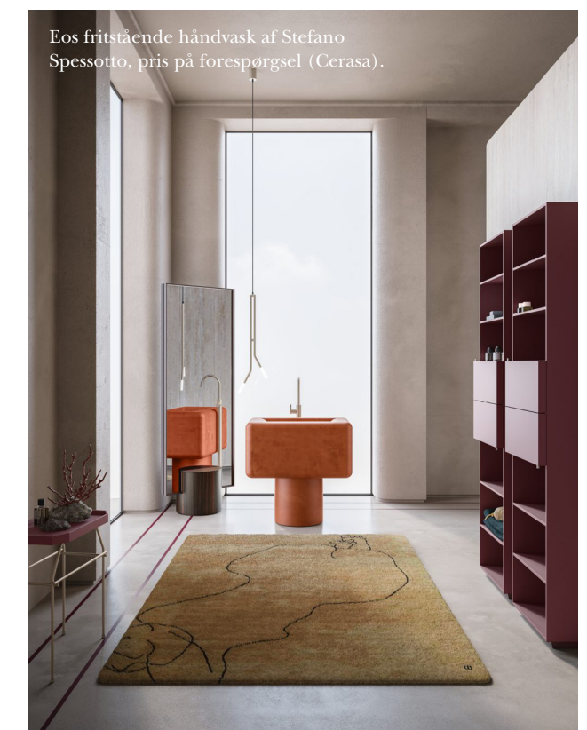
Eos fritstående håndvask af Stefano Spessotto, pris på forespørgsel (Cerasa).