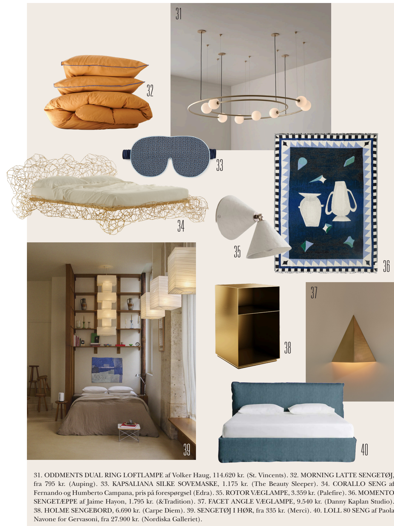
31. ODDMENTS DUAL RING LOFTLAMPE af Volker Haug, 114.620 kr. (St. Vincents). 32. MORNING LATTE SENGETØJ, fra 795 kr. (Auping). 33. KAPSALIANA SILKE SOVEMASKE, 1.175 kr. (The Beauty Sleeper). 34. CORALLO SENG af Fernando og Humberto Campana, pris på forespørgsel (Edra). 35. ROTOR VÆGLAMPE, 3.359 kr. (Palefire). 36. MOMENTO SENGETÆPPE af Jaime Hayon, 1.795 kr. (&Tradition). 37. FACET ANGLE VÆGLAMPE, 9.540 kr. (Danny Kaplan Studio). 38. HOLME SENGEBOORD, 6.690 kr. (Carpe Diem). 39. SENGETØJ I HØR, fra 335 kr. (Merci). 40. LOLL 80 SENG af Paola Navone for Gervasoni, fra 27.900 kr. (Nordiska Galleriet).