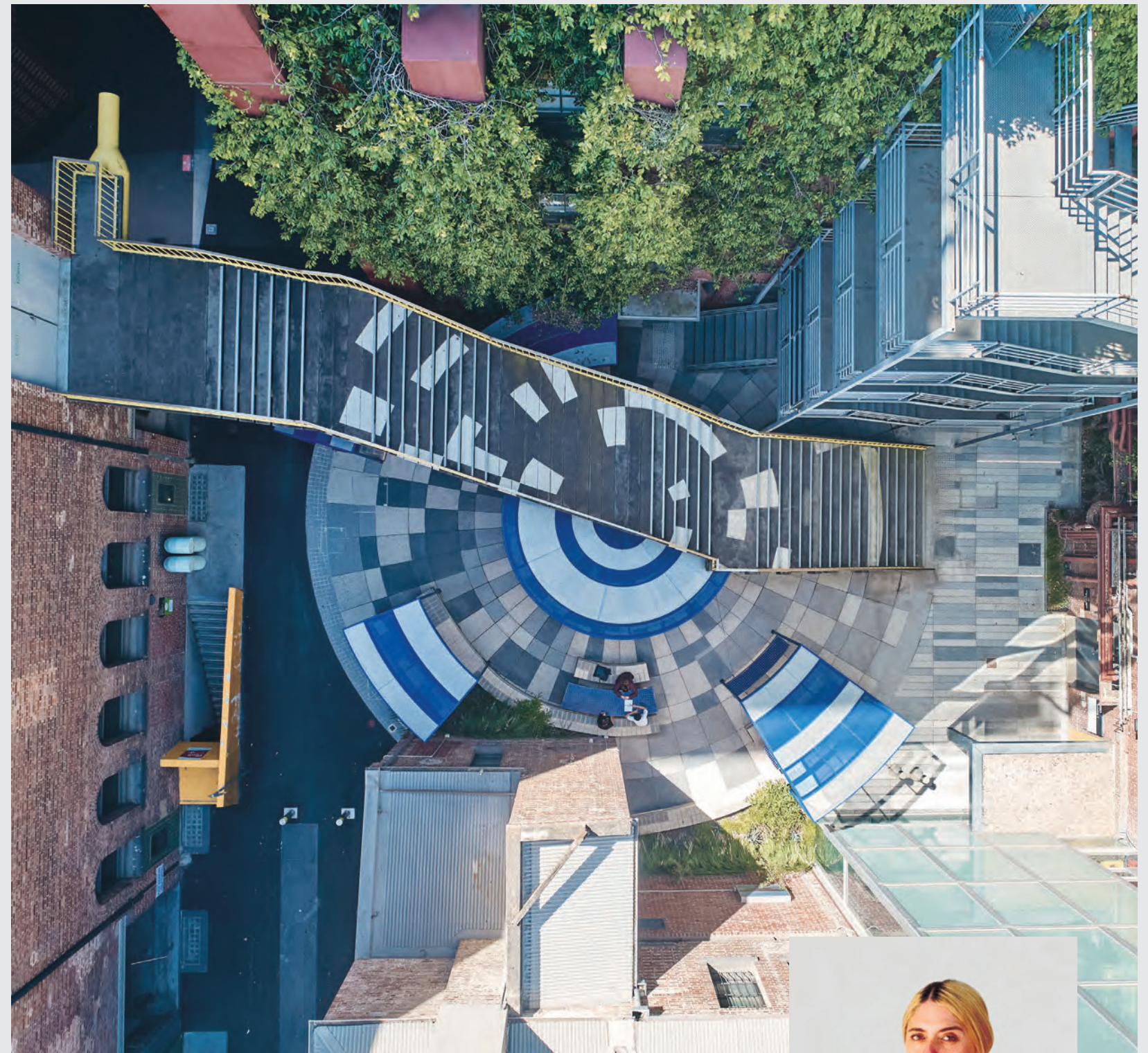
Photo: VSI. ASAI IFI World Interiors Day event at Stilhaus Rothrist.

In foto: Evento di VSI. ASAI per l'IFI World Interiors Day presso Stilhaus, Rothrist.