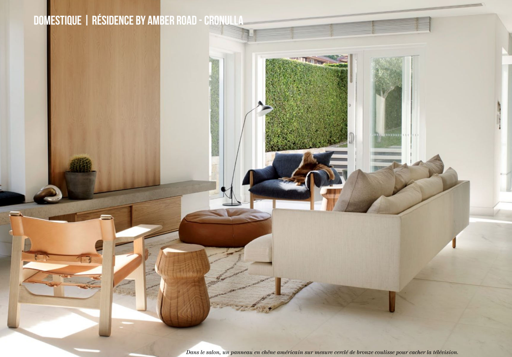
Dans le salon, un panneau en chêne américain sur mesure cerclé de bronze coulisse pour cacher la télévision.