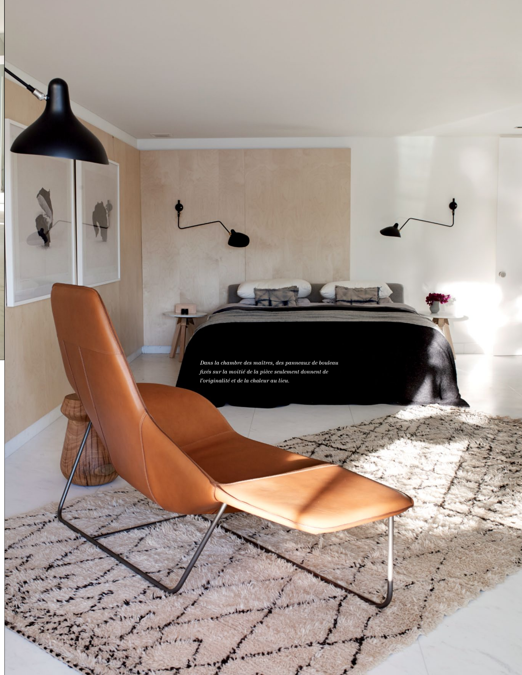
Dans la chambre des maîtres, des panneaux de bouleau fixés sur la moitié de la pièce seulement donnent de l'originalité et de la chaleur au lieu.