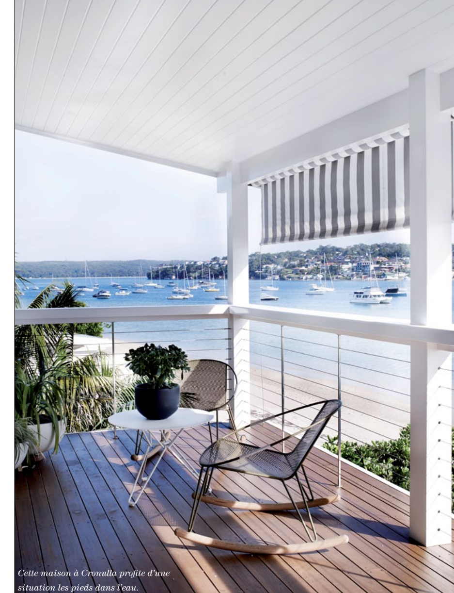
Cette maison à Cronulla profite d'une situation les pieds dans l'eau.

Au sud de Sydney en Australie, l'agence Amber Road a entièrement repensé les intérieurs de cette résidence à Cronulla en les magnifiant aussi naturellement que possible, de manière presque minimaliste. Revue de détails.