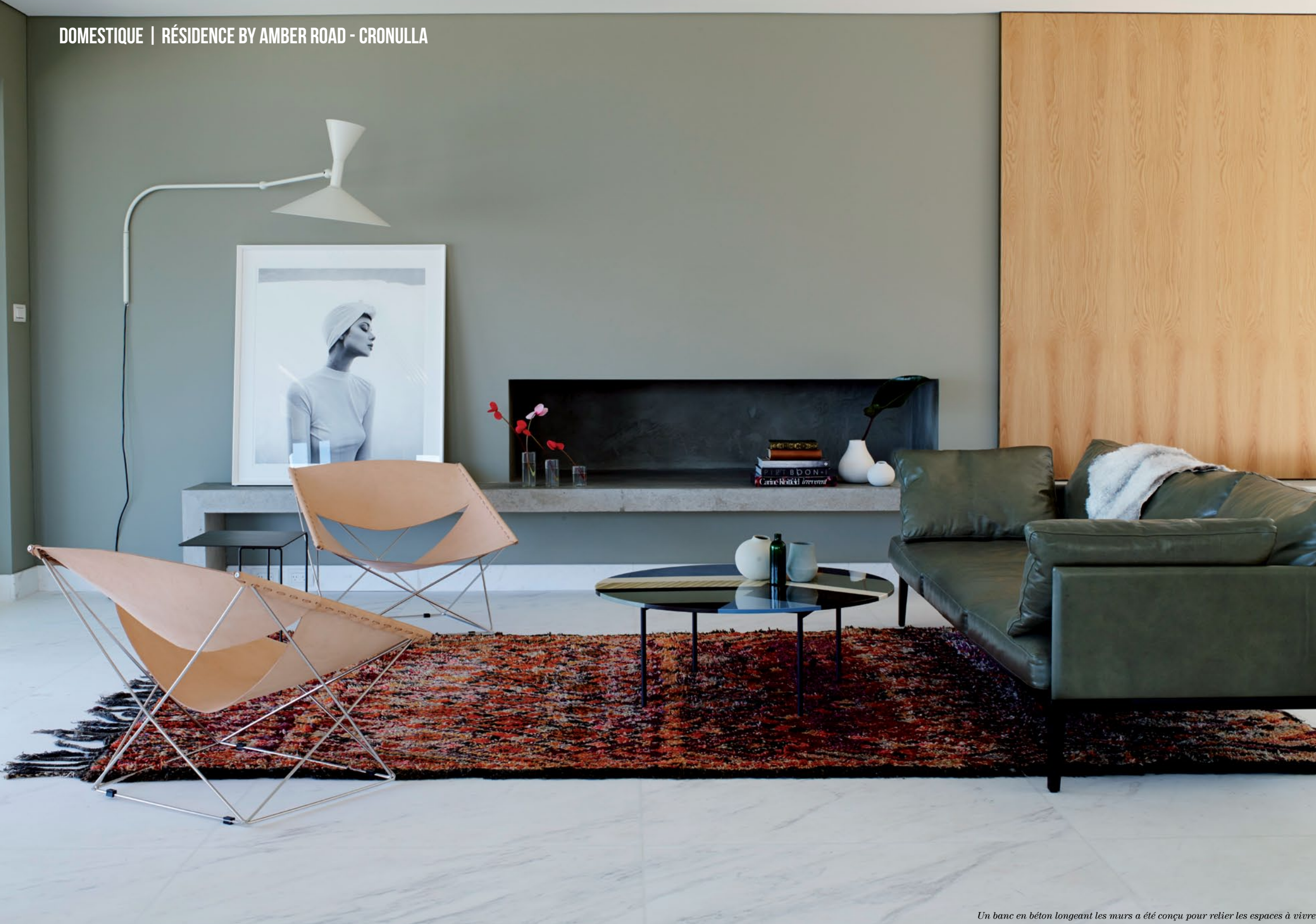
Un banc en béton longeant les murs a été conçu pour relier les espaces à vivre.